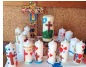
Osterwoche = Ostervielfalt: Bunte Aktionen nahmen Kinder in die Ostererzählungen hinein