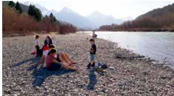
6. bis 8.4. – Pilotprojekt und Stärkung: Freizeit des Teams für Familienarbeit in Füssen