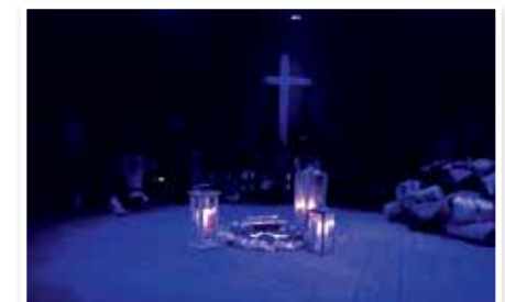
31. März – 1. April Osternacht rund ums Tipi