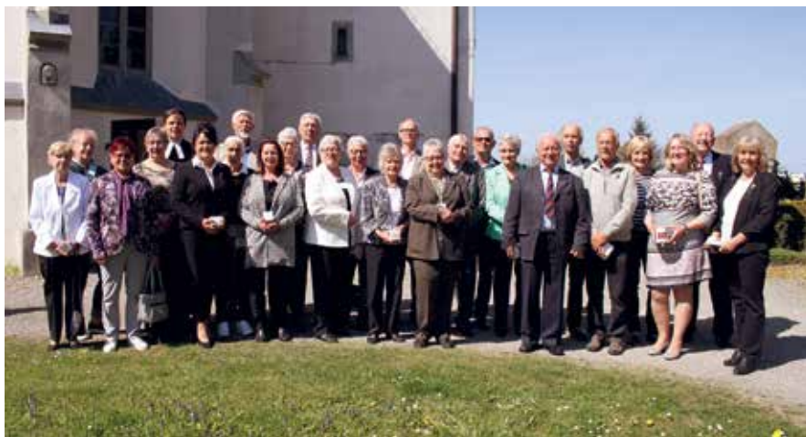
25 Jubelkonfirmanden trafen sich zu einem Festgottesdienst in St. Verena.

Mo 9.7. Sommerfest in Eglofs im Gasthaus: „Ochs am Berg“, die pflegenden Angehörigen verbringen gemeinsam mit den Gepflegten bei Kaffee und Kuchen, Musik und Tanz einen entspannten Nachmittag. Bitte anmelden.